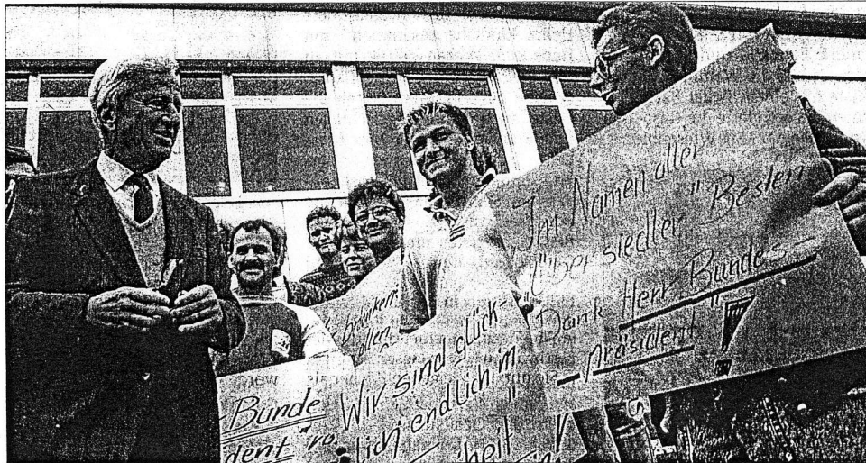
1989 begrüßte Bundespräsident Richard von Weizsäcker in Ahrweiler die ersten DDR-Übersiedler.

Das Publikum verlangt nach immer mehr Details. So beantwortet der 79-Jährige auch die Frage nach dem berühmten Zettel. „Eigentlich sollte die neue Reiseregelung um vier Uhr nachts im Radio verkündet werden, wenn alle schlafen. Aber von dieser Sperrfrist wusste ich nichts.“ Sich selbst spricht er beim Fall der Mauer nur eine Nebenrolle zu. „Nicht ich, sondern die vielen Demonstranten und die Volkspolizei haben die Mauer geöffnet. Und beide haben es nicht zu einer Eskalation kommen lassen.“